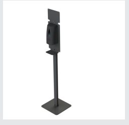
Détection automatique - Ref 1630189